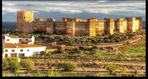
CASTELLO - BAÑOS