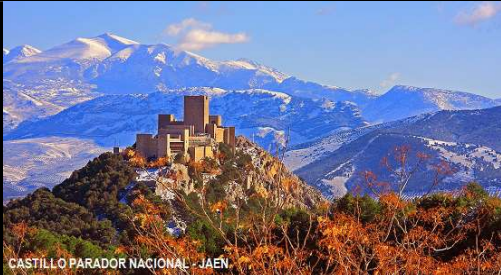
CASTILLO PARADOR NACIONAL - JAÉN

Dentro de nuestro servicio de taxi, como servicio público, ofrecemos rutas personalizadas con un conductor que conoce a la perfección monumentos, restaurantes y lugares más recónditos de sitios a visitar, para ayudarle a que los conozca y se enriquezca de historia y cultura.