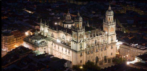
CATEDRAL DE NOCHE - JAÉN